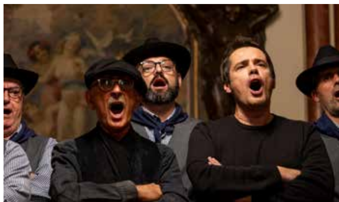
Momento de Cante na Casa do Alentejo, Lisboa