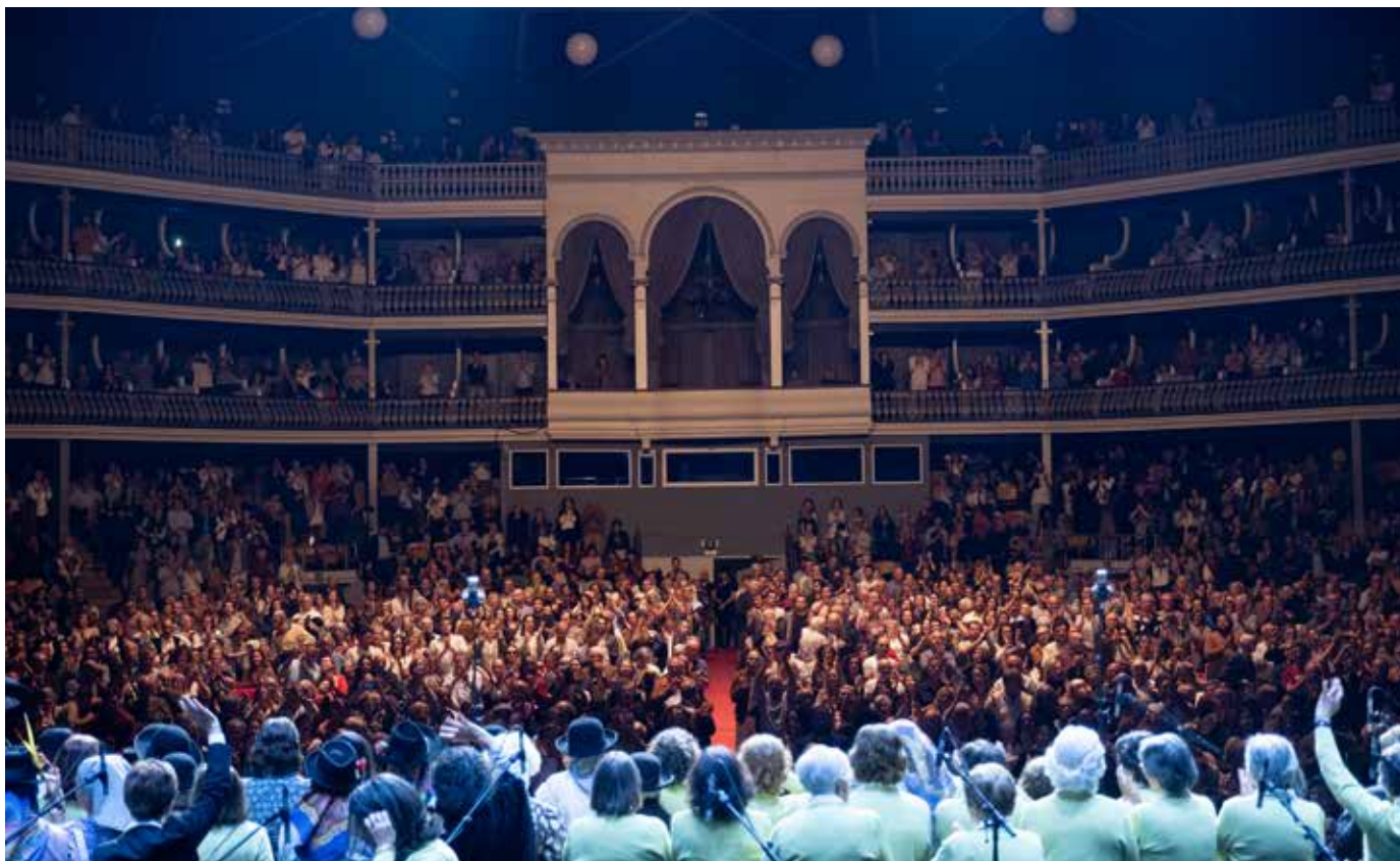
Concerto EnCanto Sinfónico, Lisboa - Coliseu dos Recreios

No dia 3 de novembro, o Coliseu dos Recreios, em Lisboa, recebeu o concerto EnCanto Sinfónico, uma iniciativa do Município de Serpa e do Museu do Cante Alentejano para assinalar os 10 anos da inscrição do Cante Alentejano na Lista Representativa do Património Cultural Imaterial da UNESCO.