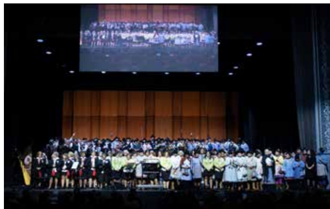
Concerto incluiu modas do Cancioneiro Popular Alentejano