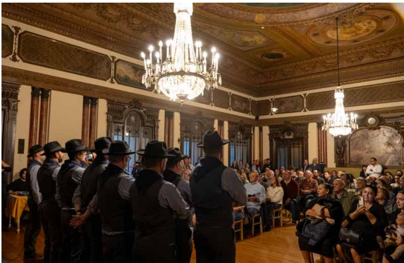
Casa do Alentejo, em Lisboa, acolheu mais um momento de Cante Alentejano protagonizado pelo Grupo Coral do Estabelecimento Prisional de Beja