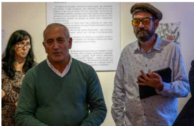
Momento da inauguração da exposição de pintura "Santas Cruzes e Jordões"