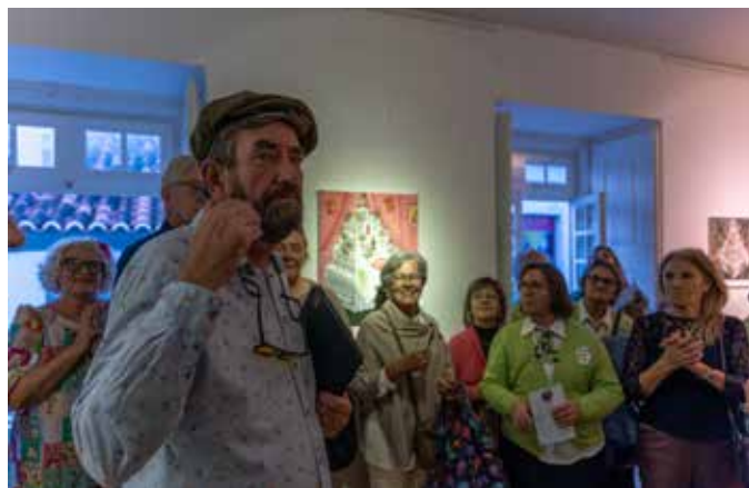
Exposição de pintura de Andrew Smith no Museu do Cante Alentejano, Serpa